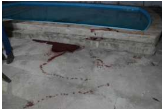
Figura 5. Sangue próximo à piscina.

Nesse caso, ainda que pareça existir um motivo racional para o crime (vingança contra um possível roubo ou traição envolvendo o funcionário), a forma como ele foi executado denota dificuldade em planejamento, deixando um grande número de testemunhas à disposição da justiça e vestígios de autoria (característica de um criminoso desorganizado). No exame de local, além de sangue (Figura 5), diversas munições de revólver calibre .38 SPL foram encontradas no interior da residência do autor, que podem ser visualizadas na Figura 6.