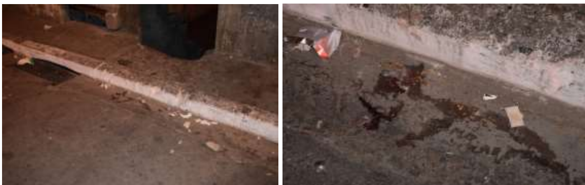
Figura 7. Sangue da vítima no local e embalagem plástica contendo material particulado.

A mesma referência prevê o encontro de resquícios de entorpecentes na cena de crime, fator também observado no caso em estudo no qual, além do sangue no local, foi encontrada uma embalagem plástica contendo resquícios de material particulado branco (Figura 7), cujo teste de Scott realizado no local revelou resultado positivo para cocaína, sendo mais um sinal do envolvimento a vítima (que já era criminoso habitual) com drogas (Figura 8).