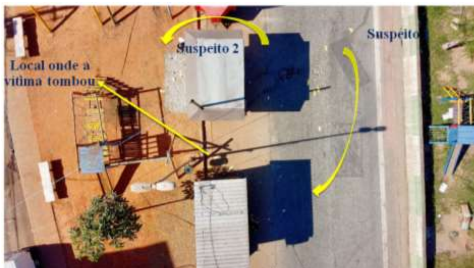
Figura 10. Movimentação dos autores durante o homicídio.

A classificação desses criminosos dentro da tipologia do FBI como organizados aqui é sugerida pelo planejamento do crime em local e horário propícios, em que não havia testemunhas e em um ponto específico da rua onde não havia câmeras. Essa observação encontra apoio nos trabalhos de Konvalina 1 , Ressler e Burgess 4 , Canter 5,7 e Holmes & Holmes 2 , consistindo em uma medida contra forense que busca minimizar as chances de identificação dos criminosos. Embora uma quantidade grande de tiros tenha sido efetuada (fato comum quando os criminosos querem deixar um “recado”), a motivação nesse caso parece se enquadrar dentro do espectro mais racional envolvendo uma relação anterior entre a vítima e os autores; essa última observação é corroborada pelo fato de que os cartuchos de munição encontrados possuíam número de série, sendo de origem de corporações policiais 11 . A tabela 5 sumariza os dados acerca do caso.