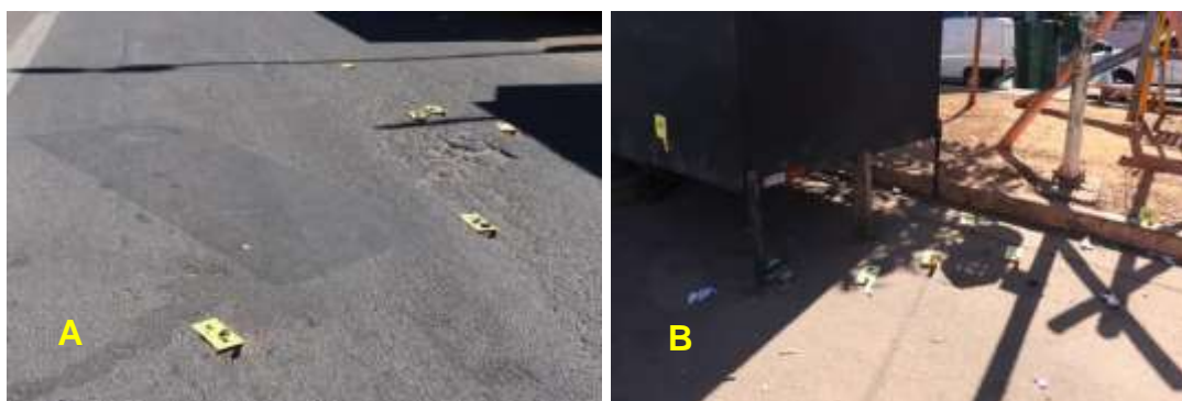
Figura 9. Grande quantidade de cartuchos deflagrados no local.

A análise dos vestígios balísticos encontrados no local (distanciamento entre grupos de cartuchos deflagrados e rastro dos mesmos) indica que havia ao menos dois autores que dispararam contra a vítima (Figuras 9 e 10). Os autores usavam um automóvel para se locomover.