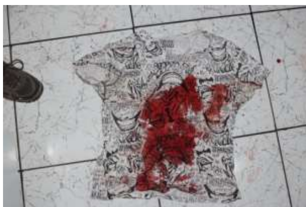
Figura 2. Camisa usada pelo autor deixada no local.

Os vestígios em abundância sugerem fúria no momento dos fatos, com violência em excesso; o autor também não se preocupou em esconder a arma do crime (que era, inclusive, uma arma improvisada no momento) ou outros vestígios, como suas roupas sujas e sangue.