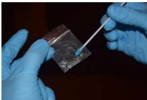
Figura 8. Teste de Scott (Resultado positivo para cocaína)