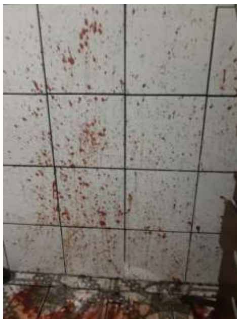
Figura 3. Sangue abundante (B) denotando sobreviolência.

Nesse caso, o autor matou sua namorada com golpes de barra de ferro, usando de nítida sobreviolência (Figura 3); além disso, o autor matou a vítima na frente do filho dela. A vítima possuía ainda um bebê em gestão, fruto de relacionamento com outro homem e morava junto ao autor. Após o feminicídio, o autor tomou banho e trancou o filho da vítima com o corpo, deixando lá a barra de ferro e foi trabalhar. Postou no Facebook uma foto com a vítima (viva) e escreveu “Luto”. Comunicou o irmão da vítima por telefone sobre seu feito.