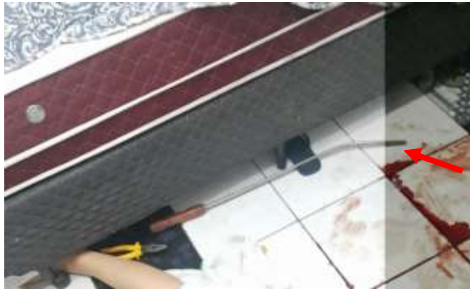
Figura 4. Barra de ferro usada pelo autor (vide seta vermelha ilustrativa).

tirar a vida da vítima, o que está de acordo com a literatura 6 para esse tipo de crime e associado a um agressor desorganizado, empregando uma arma improvisada (Figura 4) e incapaz de planejar o crime (deixando a arma no local), rendendo-se a um pico de estresse.