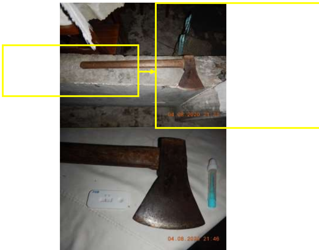
Figura 11. Machado com vestígios de sangue encontrado no local e usado pelo autor durante o homicídio.

Em nosso último estudo de caso, um local que demonstra comportamento e motivação racionais e capacidade de planejamento do crime, além de comportamento insidioso. Um homem foi encontrado morto em sua cama, com uma lesão na cabeça. O homem morava com seu sobrinho, autor do crime e ex-presidiário condenado por decepar a mão da ex-namorada (sugerindo predileção por violência com uso de lâminas), que se evadiu do local após os fatos. O cadáver apresentava uma lesão corto-contusa na cabeça que era compatível com a lâmina de um machado encontrado fora da residência. Embora a lâmina estivesse limpa, um teste imunocromatográfico revelou a presença de traços de sangue humano na lâmina (Figura 11).