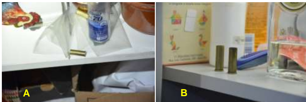
Figura 6. Estojos de munição encontrados no local.

fogo) de forma abrupta, sem que a vítima tenha chance de expressar qualquer reação de defesa.